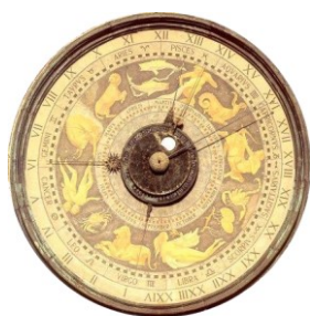
ORDINE degli INGEGNERI della PROVINCIA di CREMONA